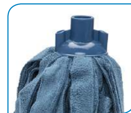
CÓDIGO EAN 8430117100300