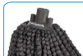
CÓDIGO EAN 8430117513001

Gramaje: 120 g (extravolumen) Composición: 100% Microfibra de Poliéster Uds/Caja: 12 Cajas/Palet: 84