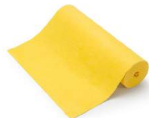
REFERENCIA BF-B6M36-AM-VISC (6m) BA-B2M36-AM-VISC (2m)