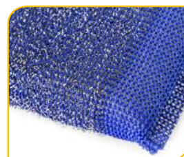
CÓDIGO EAN 8430117512790