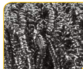
CÓDIGO EAN 8430117512776