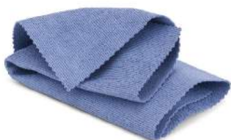
REFERENCIA ● BF-B3540-AZ-ABSR