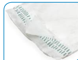
CÓDIGO EAN 8430117512349

Medidas: 60 x 24 cm Gramaje: 18 g/m 2 Composición: 100% Polipropileno Uds/Caja: 1000 Uds/Retráctil: 50 Retráctil/Caja: 20 Cajas/Palet: 80