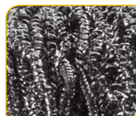
CÓDIGO EAN 8430117512783