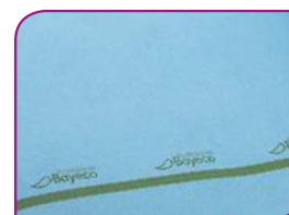
CÓDIGO EAN 843011760022