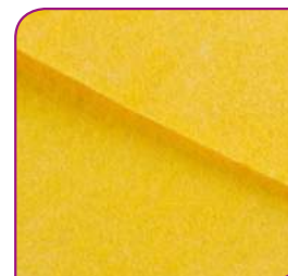
CÓDIGO EAN 8430117513148 (6 m) 8430117513162 (2 m)