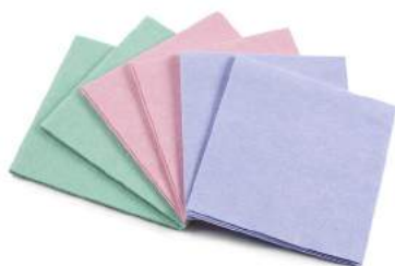
REFERENCIA ● BF-BPX12-AZ-VISC ● BF-BPX12-RO-VISC ● BF-BPX12-VE-VISC