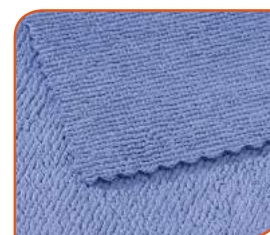
CÓDIGO EAN 843011790030